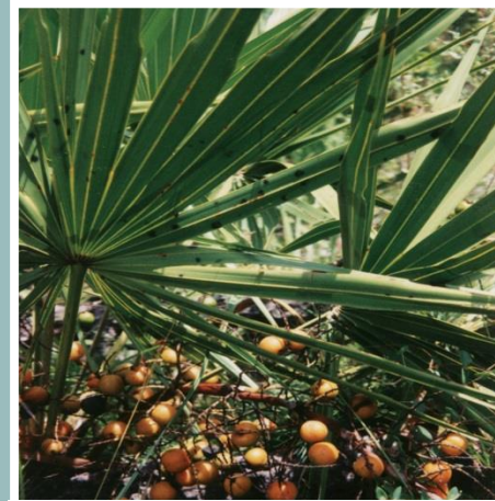
Sägepalme – Sabal serrulata