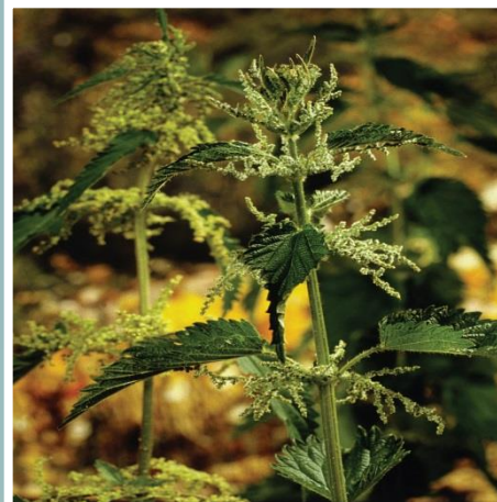
Brennesselwurzel – Urtica radix