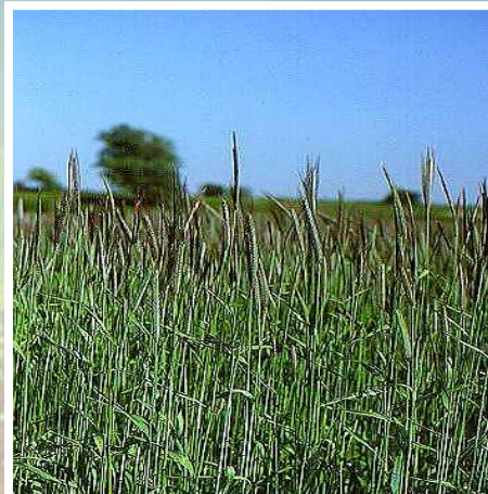
Roggenpollen – Secale cereale