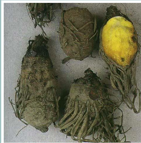
Afrikanische Knolle – Hypoxis rooperi