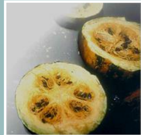
Kürbissamen – Cucurbita pepo